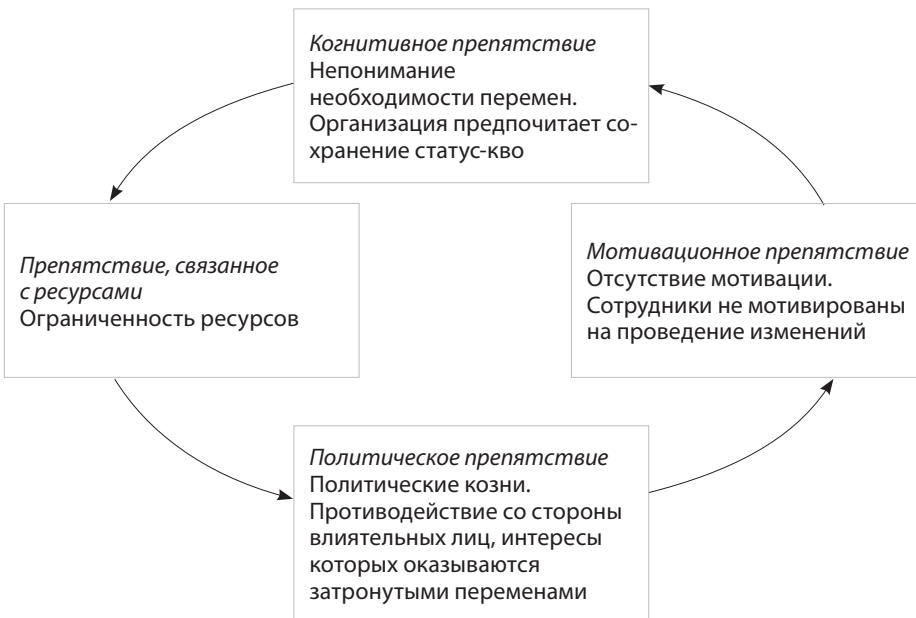
Рис. 7.1 Воплощение стратегии: четыре организационных препятствия

невзирая на необходимость преодоления всех четырех препятствий, которые, по утверждениям менеджеров, обычно ограничивают их возможности по реализации стратегий голубого океана. К этим препятствиям относятся отсутствие у сотрудников понимания необходимости проведения радикальных перемен; ограниченность ресурсов, свойственная практически всем компаниям; низкая мотивация, расхолаживающая и деморализующая персонал; политические козни, продуктом которых становится внутреннее и внешнее сопротивление переменам (рис. 7.1).